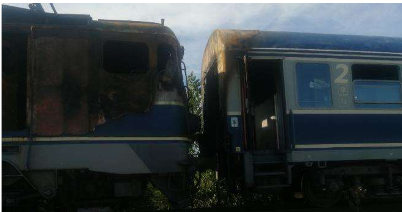
Foto nr.5 – capătul vagonului nr.50 53 22-96 024-4, afectat de incendiul produs la locomotiva EA 889