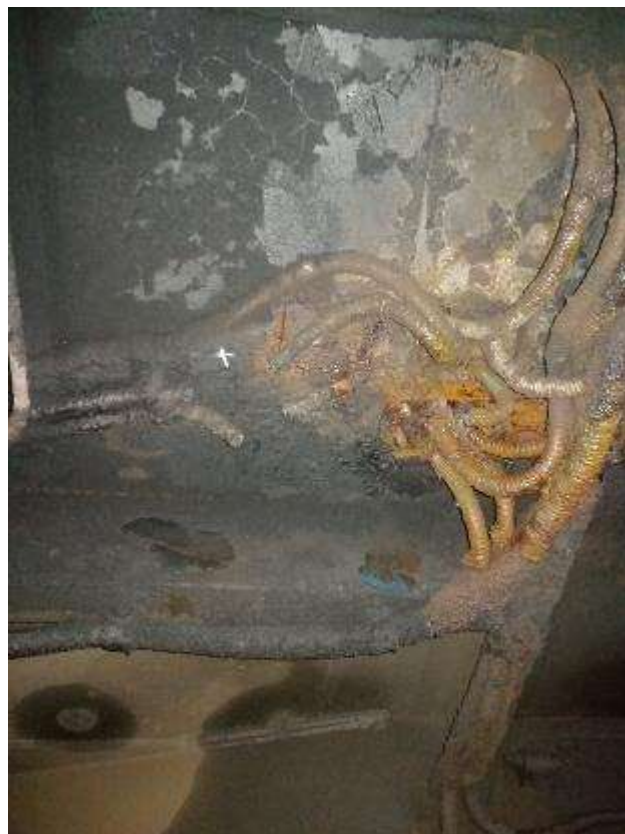
Foto nr.4 – Cablu de la bateria de acumulatori carbonizat și cu urme de arc electric în zona de traversare a podelei locomotivei spre blocul S7