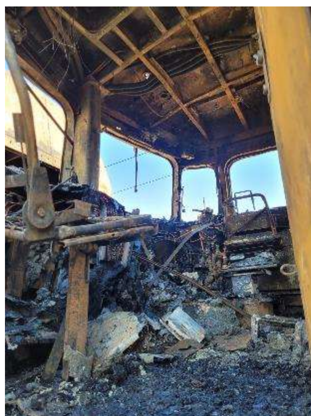
Foto nr.1 și nr.2 – postul de conducere nr.I al locomotivei EA 889 și echipamentele acesteia