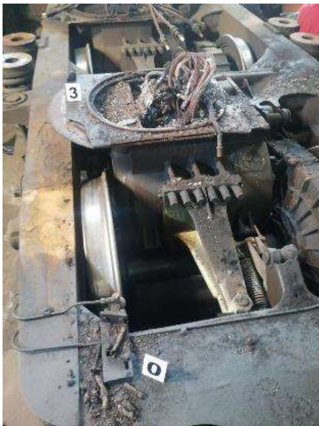
Foto nr.3 – Resturi carbonizate de tub copex și izolație provenite de la cablul bateriei de acumulatori