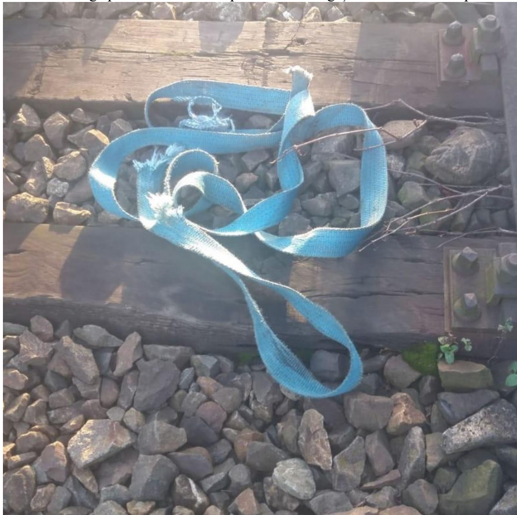
Foto nr.2. Curea de asigurare găsită în stația Frasin.

În stația Frasin, una dintre curele s-a rupt la circa 3 metri de capăt și a rămas pe terasament, fiind găsită de personalul SCB. Chinga prezintă urme de rupere urmare a agățării de anumite corpuri din cale.