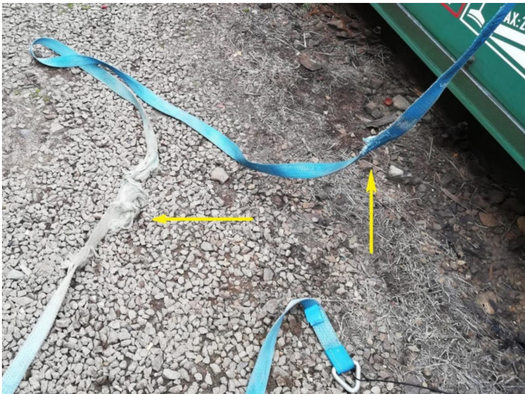
Foto nr.4. Curea degradată ca urmare a frecării cu terasamentul și tăiată parțial.