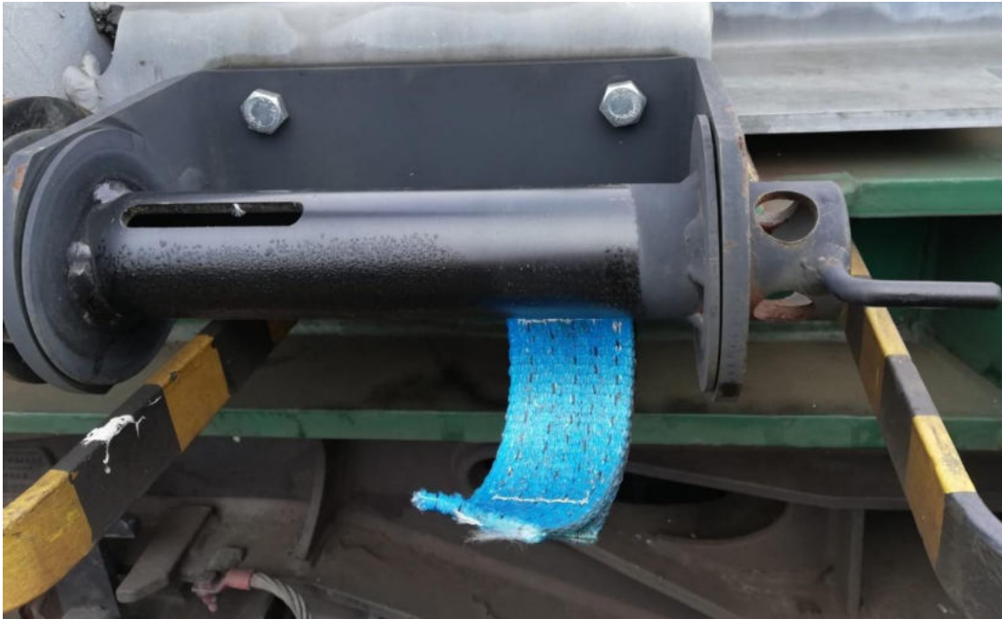
Foto nr.3. Curea de asigurare desfășurată recent și tăiată.