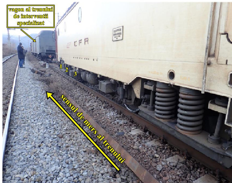
1, 2, 3 - roțile primului boghiu deraiate între firele căii

Locomotiva EA014 a circulat în stare deraiată aproximativ 260 m.